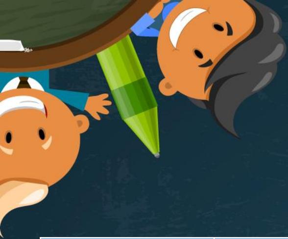
График работы ЛОГОПУНКТА